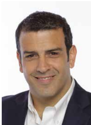
Rodrigo Delgado Mocarquer

Alcalde Municipalidad de Estación Central