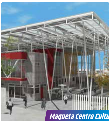
Maqueta Centro Cultural

Cerca de 23.000 mil vecinos participaron en diversas actividades, tales como: paseos por el día, rutas patrimoniales y tours comunales.