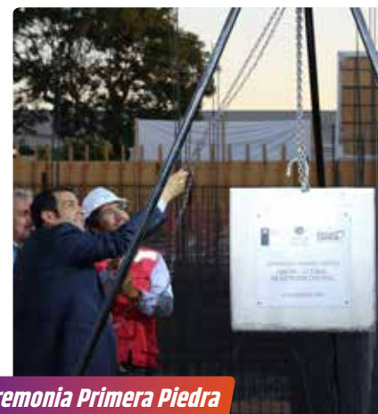
Ceremonia Primera Piedra